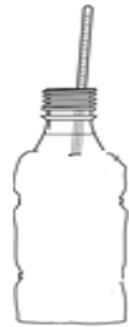
Flasche ohne Ummantelung

Teil B: Entwerft ein Experiment mit den untenstehenden Materialien, um die zweite Hypothese zu überprüfen. Beachtet die verschiedenen Größen, die sich verändern und überlegt, welche Daten ihr benötigt. Beschreibt euer Experiment unter der Tabelle.